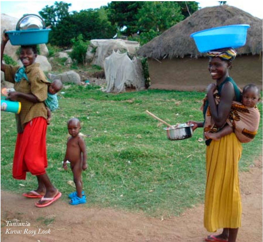
Tansania Kurva: Rosy Look

Keskeiset vastuutahot näissä kysymyksissä: UM, SM, STM